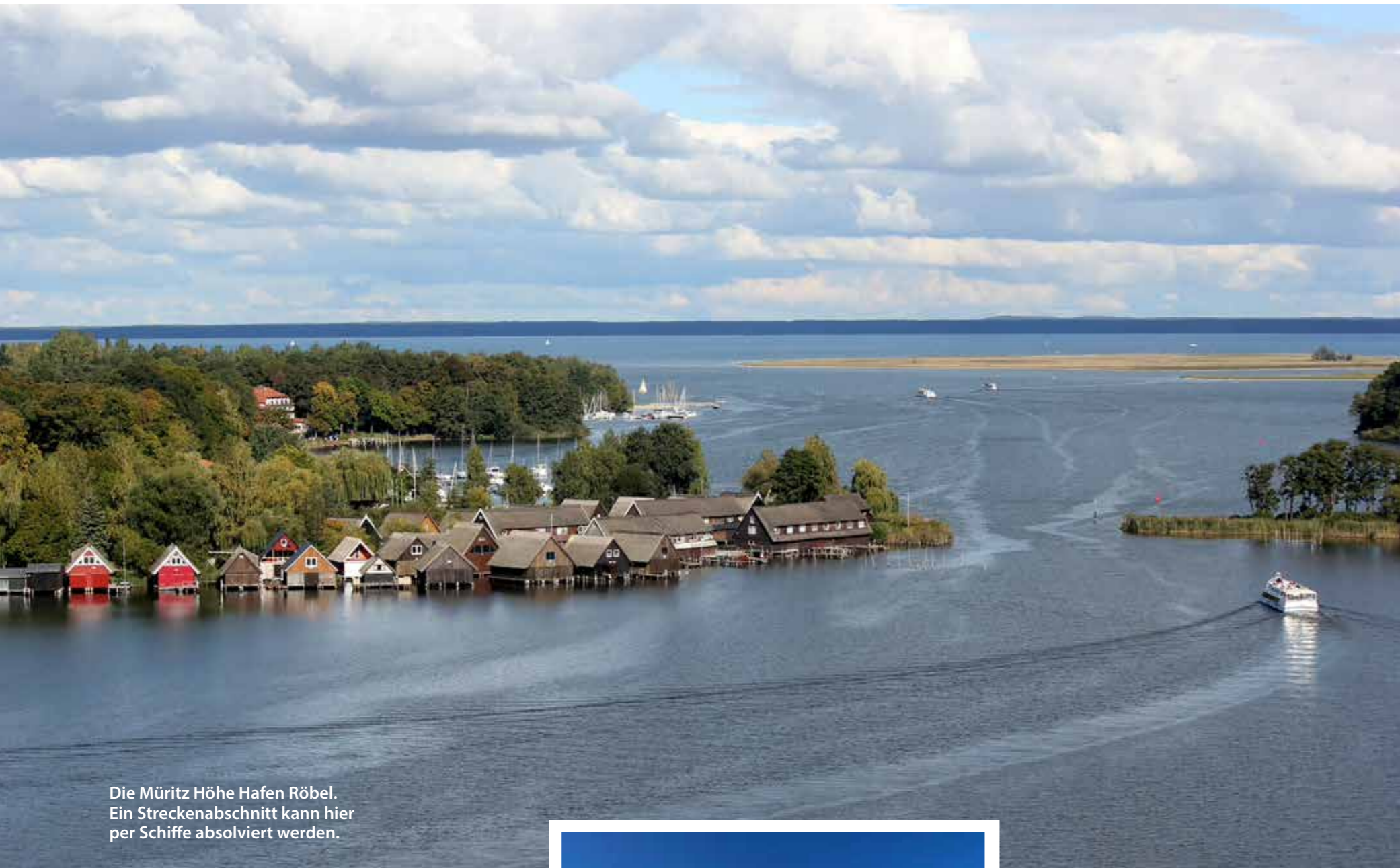
Die Müritz Höhe Hafen Röbel. Ein Streckenabschnitt kann hier per Schiffe absolviert werden.