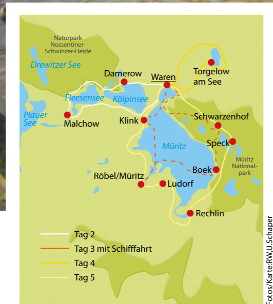
Die Müritz-Sternfahrt mit Alternativrouten.