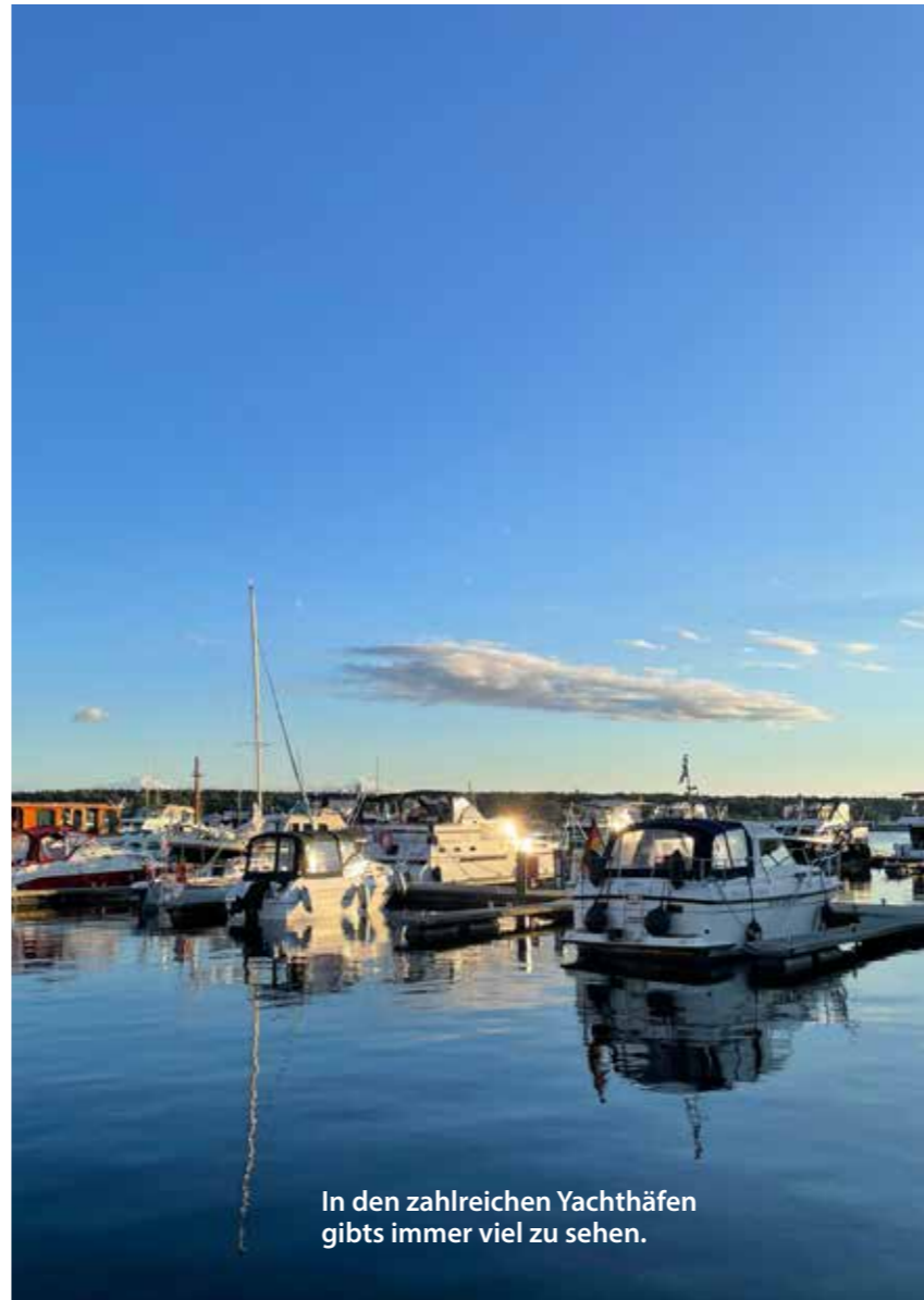
In den zahlreichen Yachthäfen gibts immer viel zu sehen.

Individuelle Rückreise bzw. Beginn Ihrer Verlängerung.