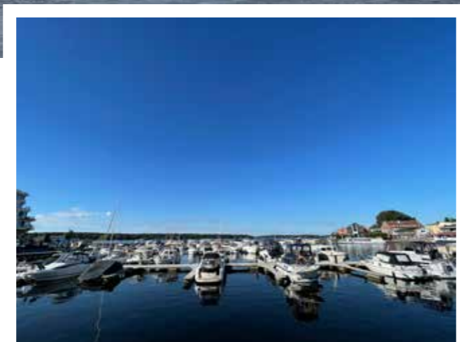
In Waren an der Müritz beginnt die interessante Radtour.