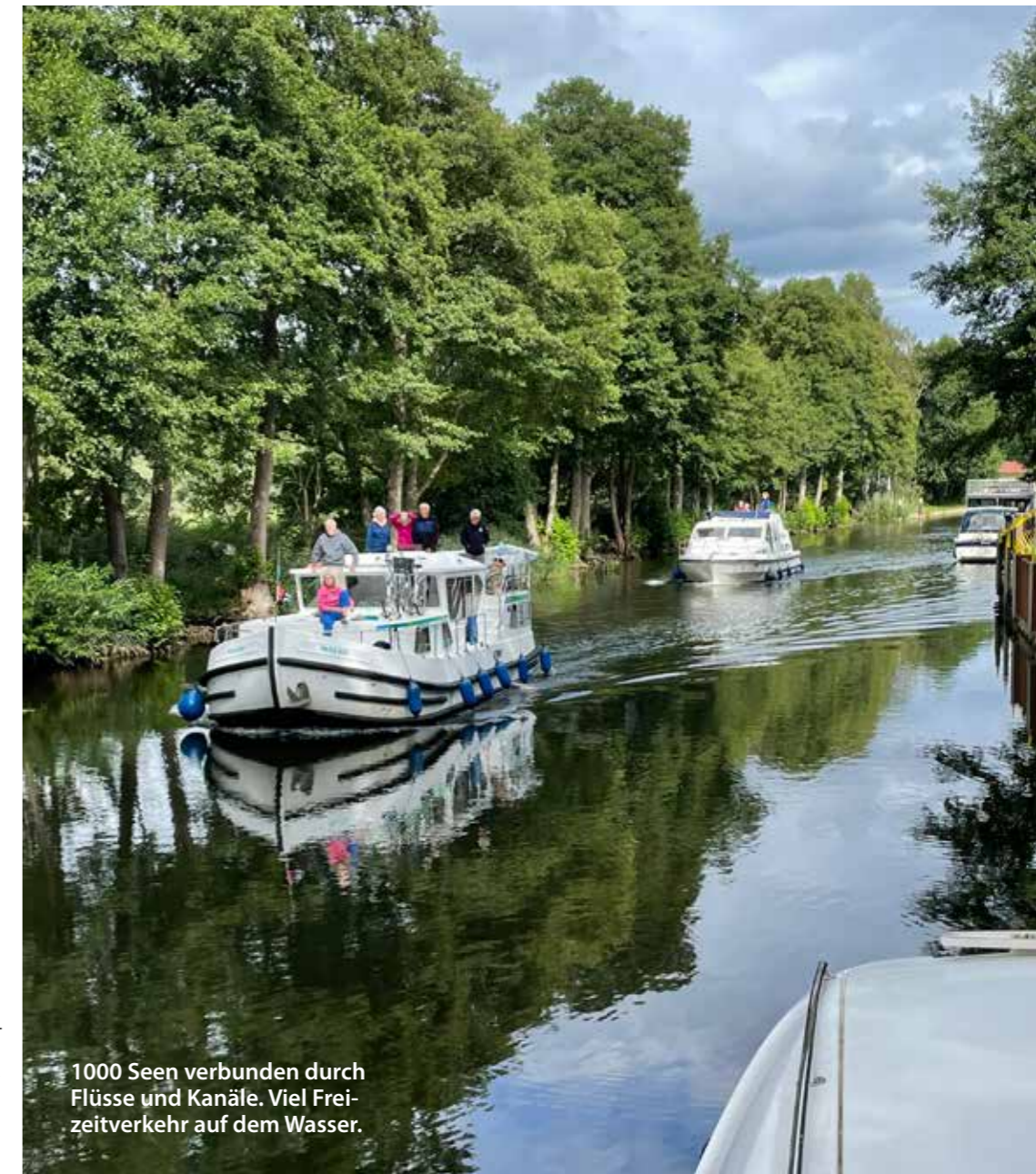
1000 Seen verbunden durch Flüsse und Kanäle. Viel Frei- zeitverkehr auf dem Wasser.

Individuelle Anreise nach Waren. Am späten Nachmittag erfolgen ein erstes Infogespräch und die Radausgabe von Leihrädern, sofern dieser Service gewünscht wurde. Die von Seen umgebene Stadt ist für die nächsten Tage unser Gastgeber. Typische nordische Backsteinbauten, wie die Kirche St. Marien oder Warens altes Rathaus, sorgen für die reizvolle Atmosphäre der Altstadt. Restaurants, Cafés und Bars mit gutem Blick aufs Wasser laden hier zum Verweilen ein.